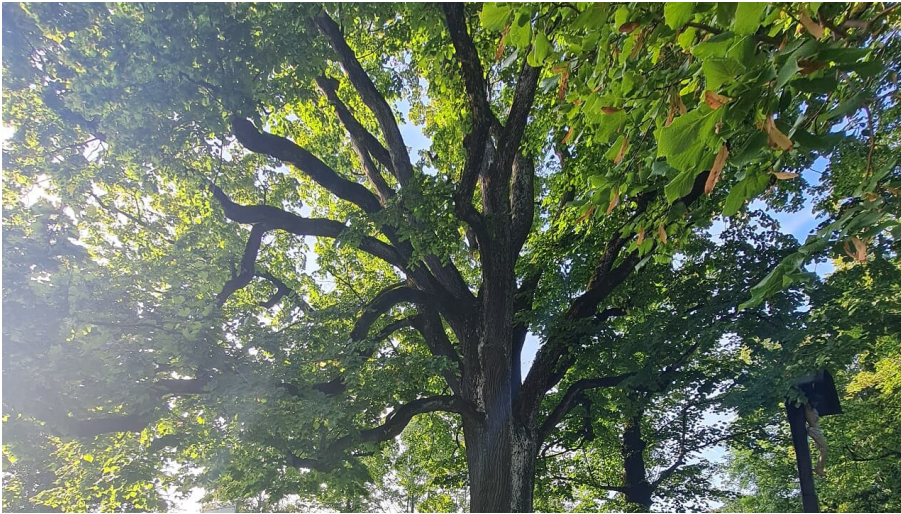
4 Linden 2 quer@Carolina Hoppen.jpg