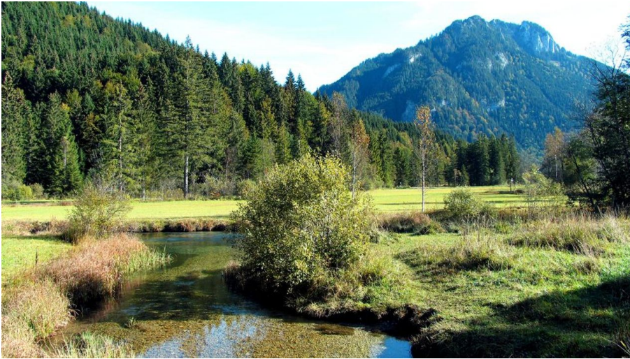
Ammerquellen im Graswangtal