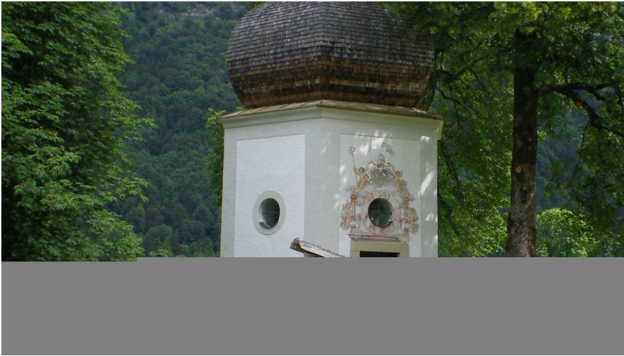
Gertrudiskapelle Horst Preisenhammer.JPG