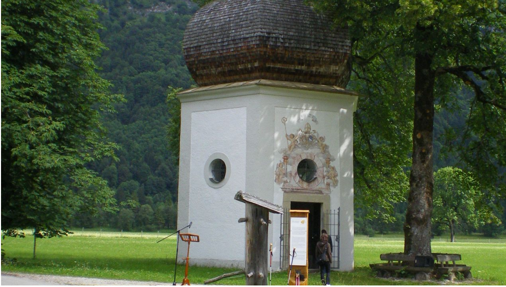
Gertrudiskapelle Horst Preisenhammer.JPG