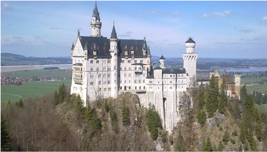
Schloss Neuschwanstein