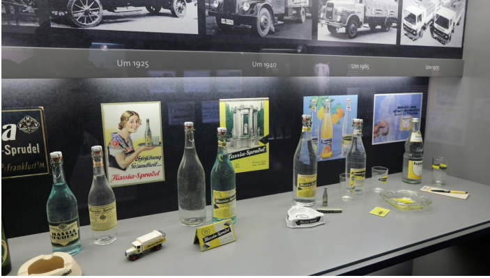
Bad_Vilbel_130518_31.JPG - © Heiko Rhode