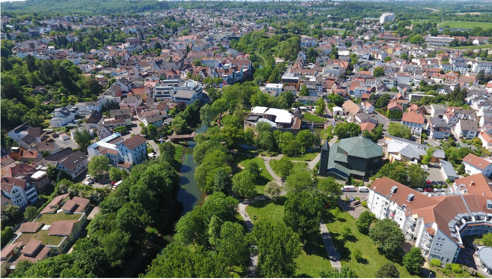
Bad Vilbel von oben