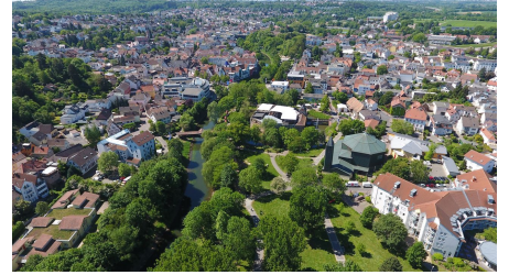
Bad Vilbel von oben