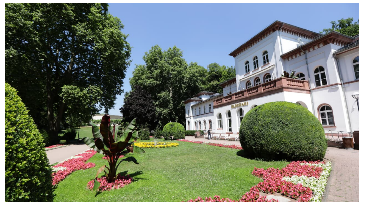
Bad Soden Badehaus