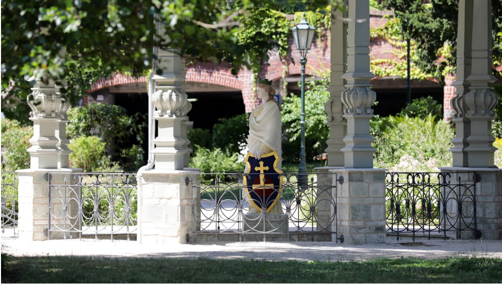
Bad_Soden_060717_44.JPG - © Heiko Rhode