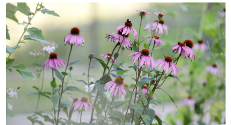
138HR - Bad Schwalbach - Roter Sonnenhut.JPG