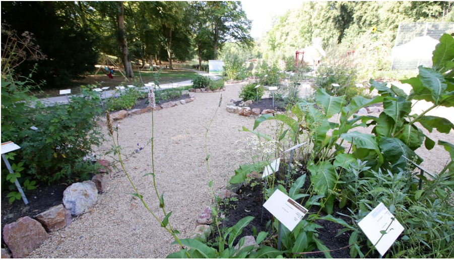
129HR - Bad Schwalbach - Kneipp Heilpflanzengarten.JPG - © Heiko Rhode