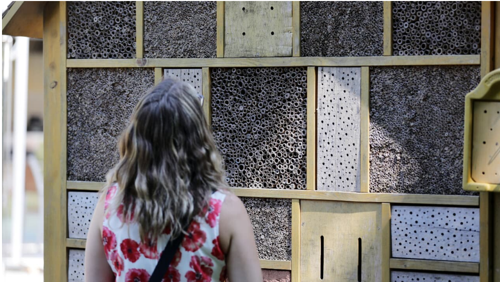
131HR - Bad Schwalbach - Insektenhotel.JPG