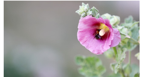
134HR - Bad Schwalbach - Malve.JPG