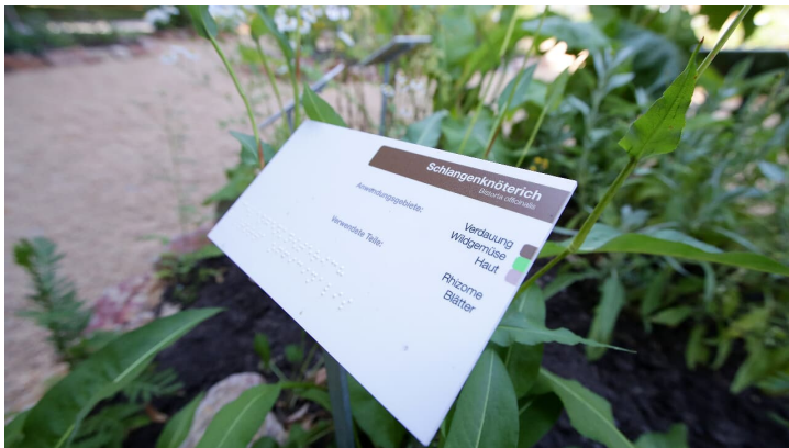
136HR - Bad Schwalbach - Kneipp Heilpflanzengarten.JPG