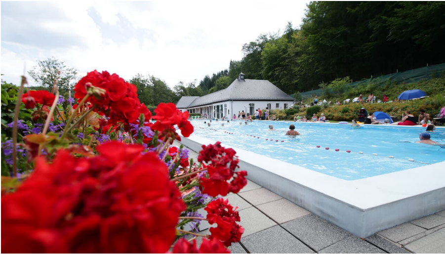
065HR - Schlungenbad - Thermalfreibad.JPG