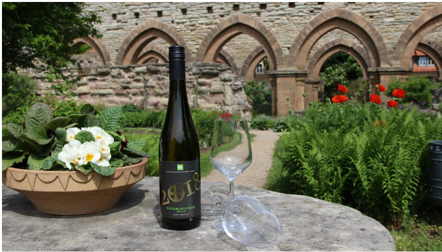
Kloster Wein