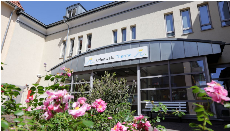
024HR - Bad König - Odenwald-Therme.JPG