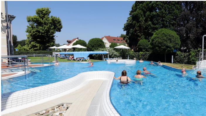
011HR - Bad König - Odenwald-Therme.JPG