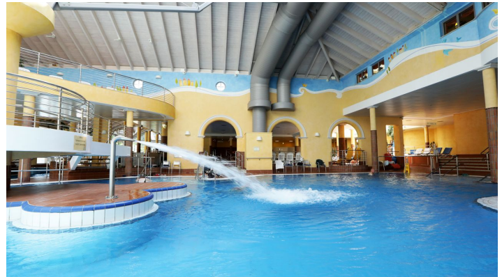
013HR - Bad König - Odenwald-Therme.JPG