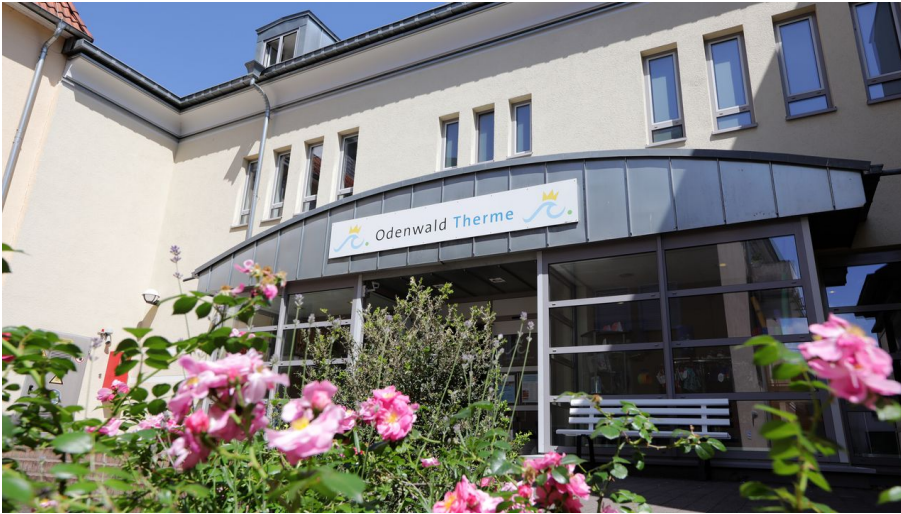
024HR - Bad König - Odenwald-Therme.JPG