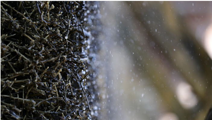
015HR - Bad Orb - Kurpark Gradierwerk.JPG