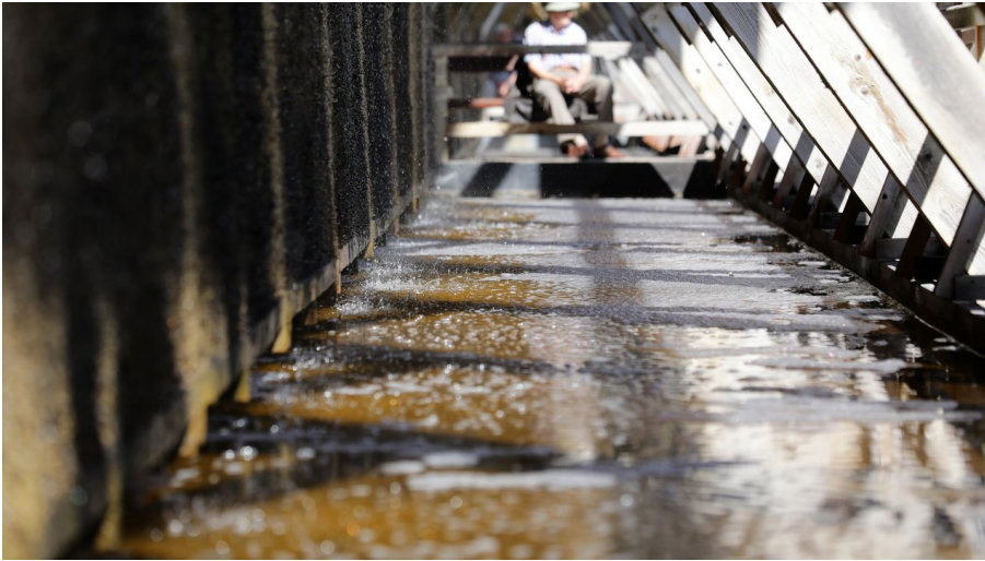
012HR - Bad Orb - Kurpark Gradierwerk.JPG