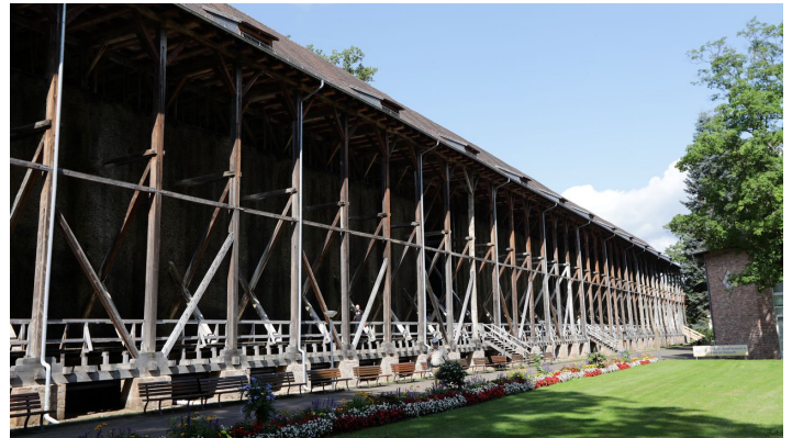
017HR - Bad Orb - Kurpark Gradierwerk.JPG