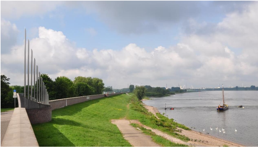
Deich Monheim am Rhein