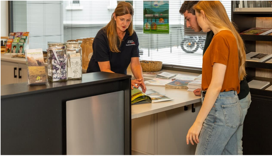
Tourist-Information am Deutschen Schloss- und Beschlägemuseum in Velbert