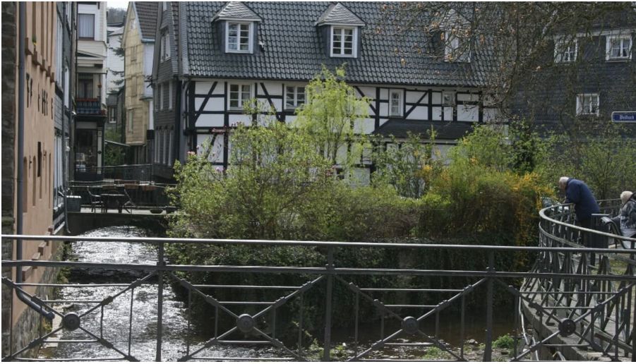
Velbert Langenberg