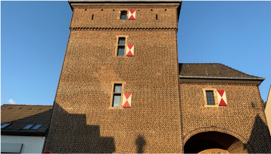
Schelmenturm in Monheim am Rhein