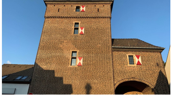
Schelmenturm in Monheim am Rhein - © Kreis Mettmann, Paula Lange