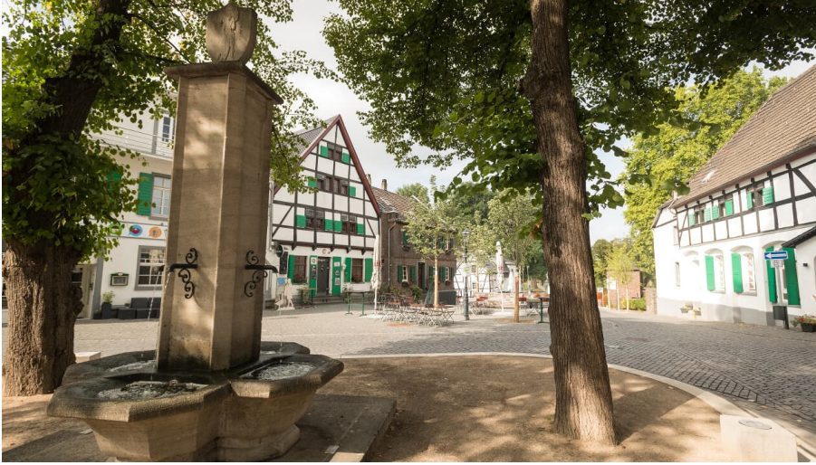
Monheimer Altstadt