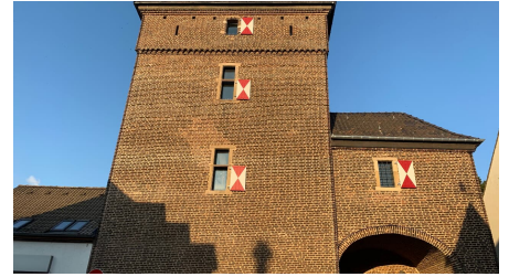
Schelmenturm in Monheim am Rhein