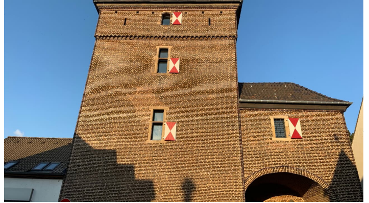
Schelmenturm in Monheim am Rhein