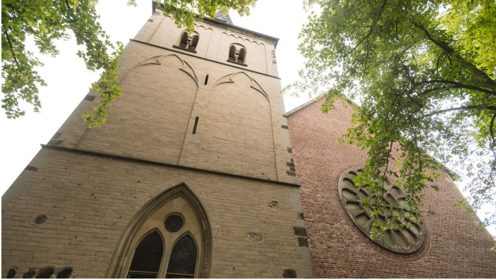
Kirche St. Gereon in Monheim am Rhein