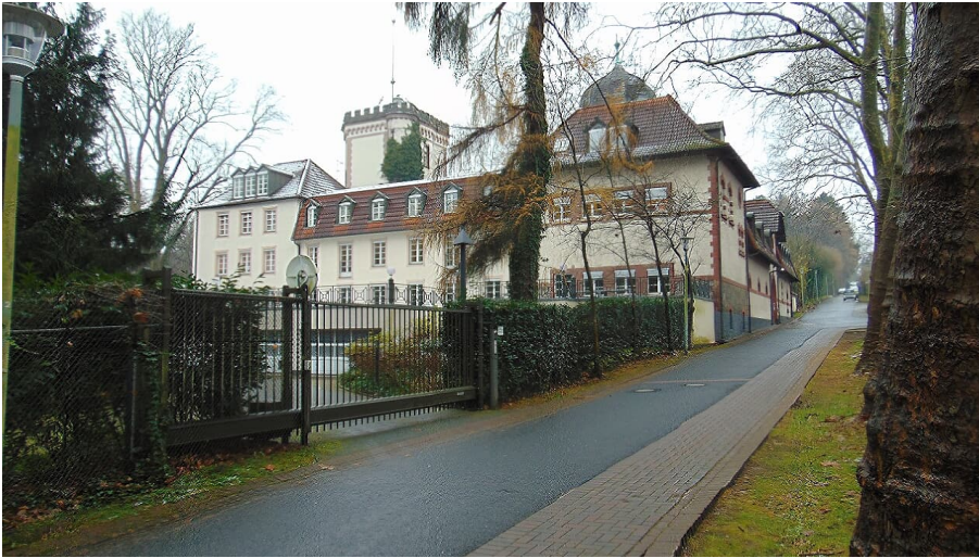
Haus Morp