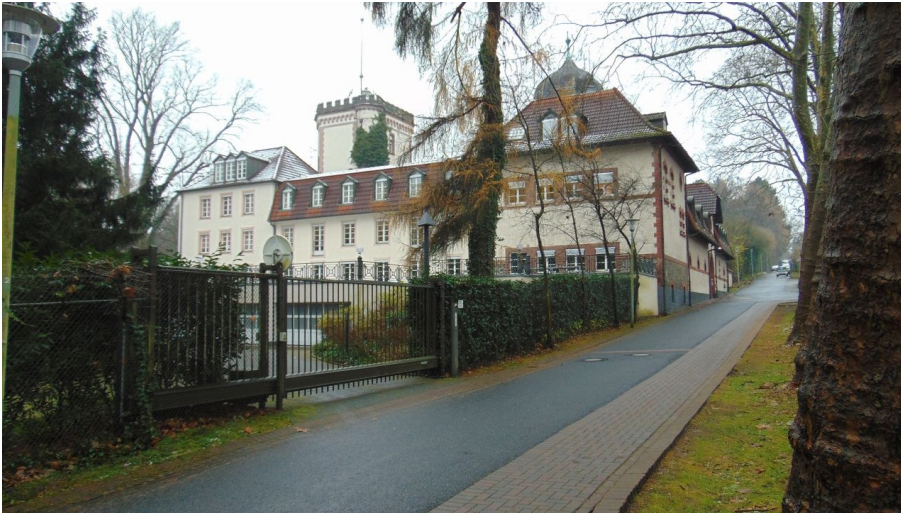
Haus Morp