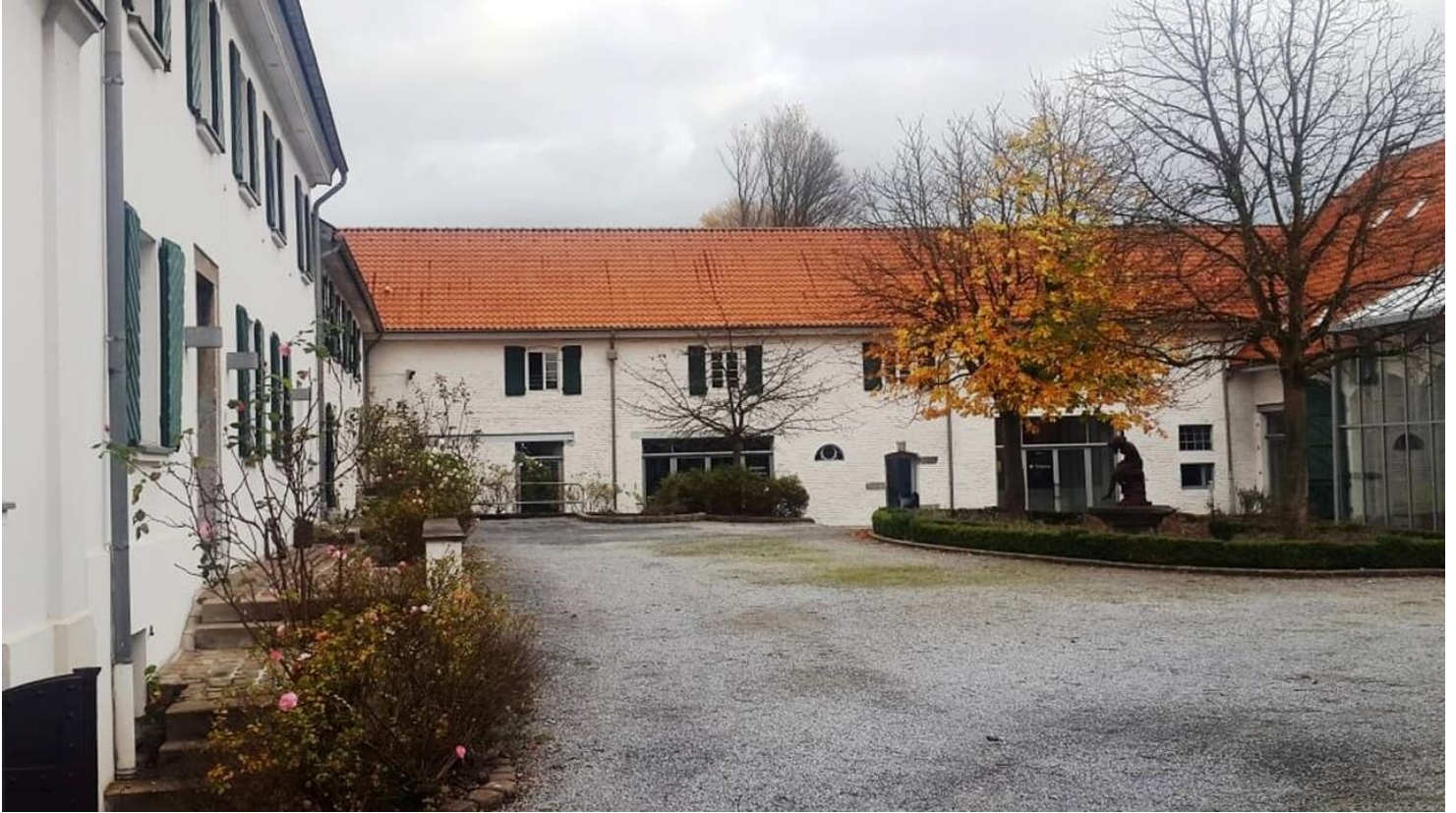
Haus Morp in Erkrath