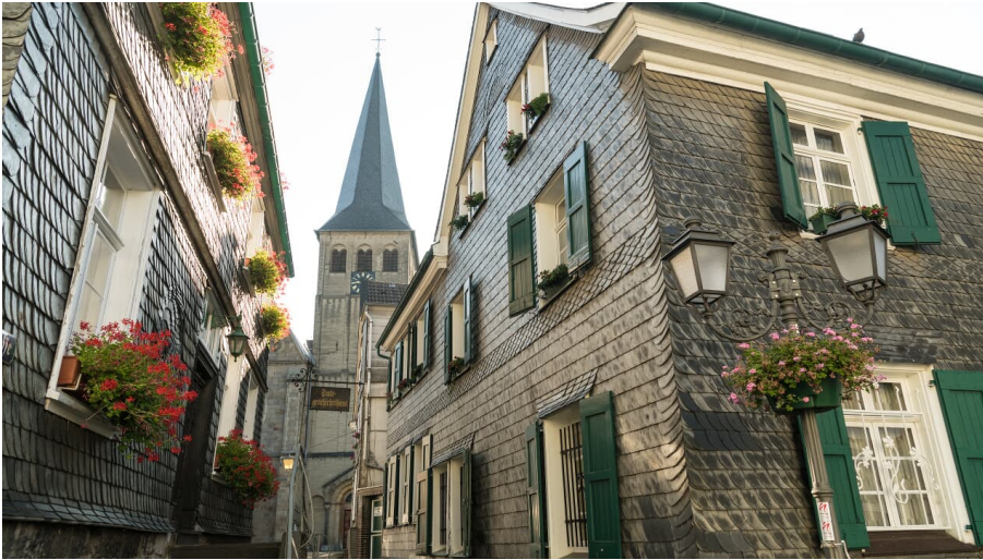
Oberstadt Mettmann mit Stadtgeschichtshaus und St. Lambertus Kirche