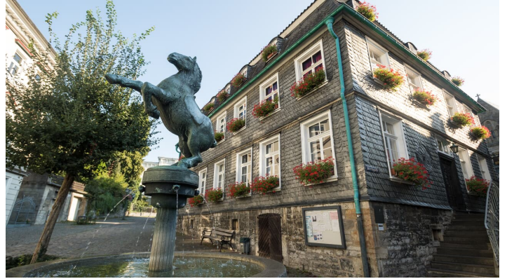
Pferdebrunnen und Stadtgeschichtshaus in Mettmann