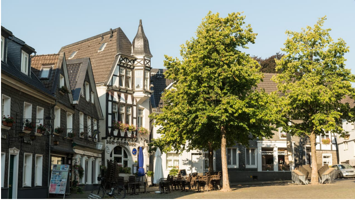
Kirchplatz der Oberstadt in Mettmann