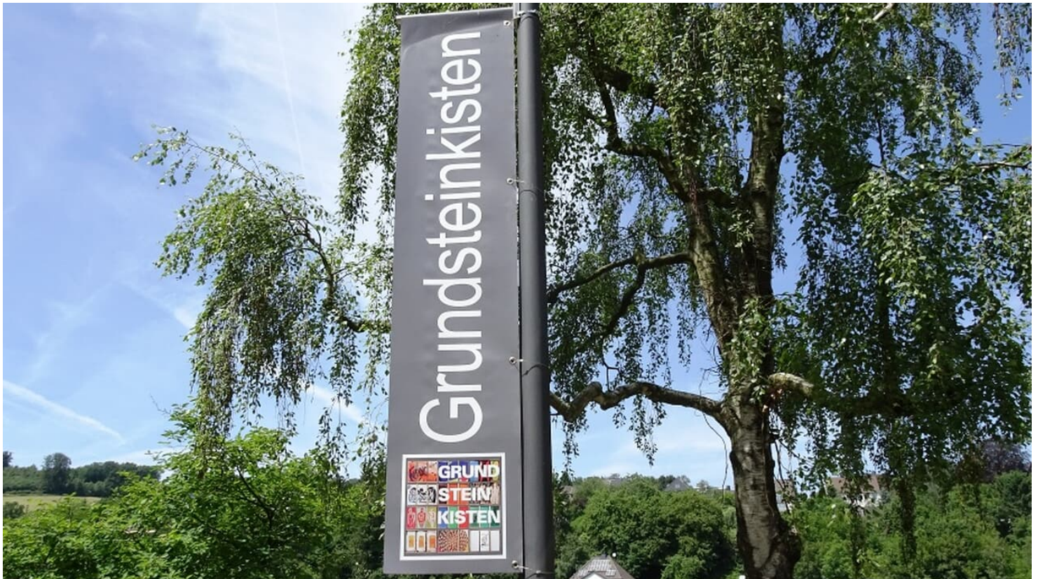
Straßenschild der Grundsteinkisten in Velbert-Langenberg

Kuratorenführung jeden 1. Sonntag im Monat 15 Uhr Sonntags 14-17 Uhr Sonderführungen ab 10 Personen