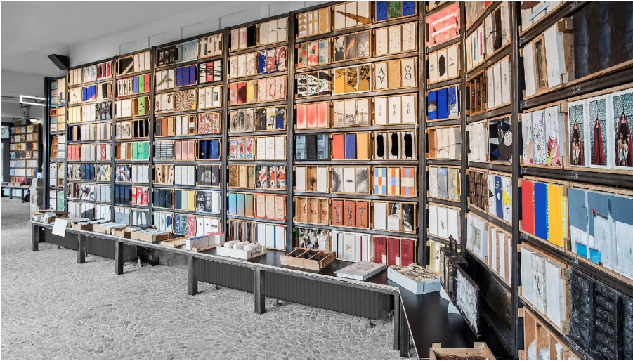
Grundsteinkiste in Velbert-Langenberg