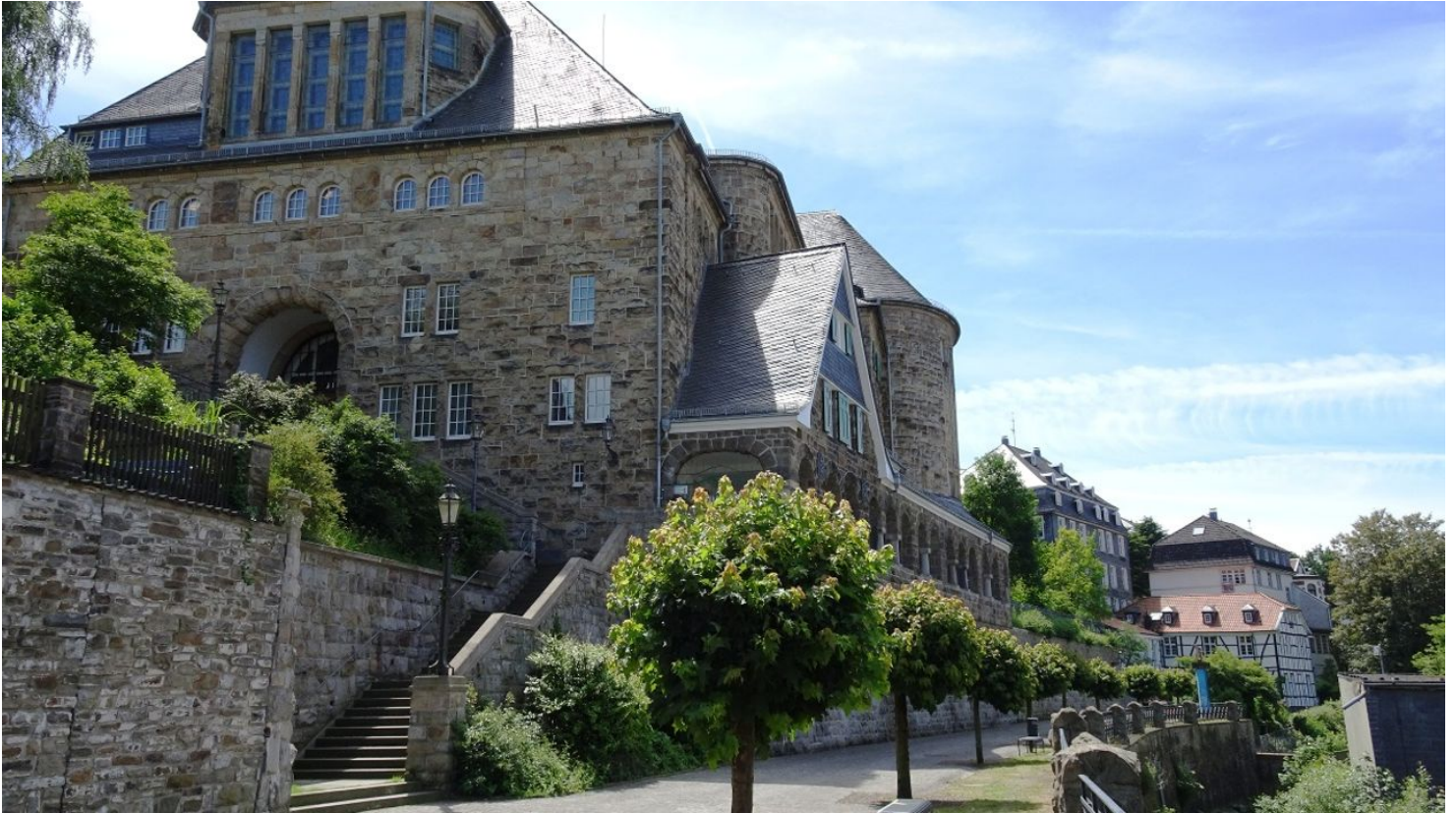
Außenansicht Historisches Bürgerhaus Langenberg