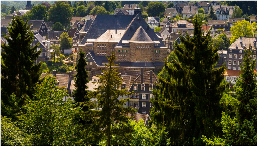
Historisches Bürgerhaus Langenberg, Velber-Langenberg