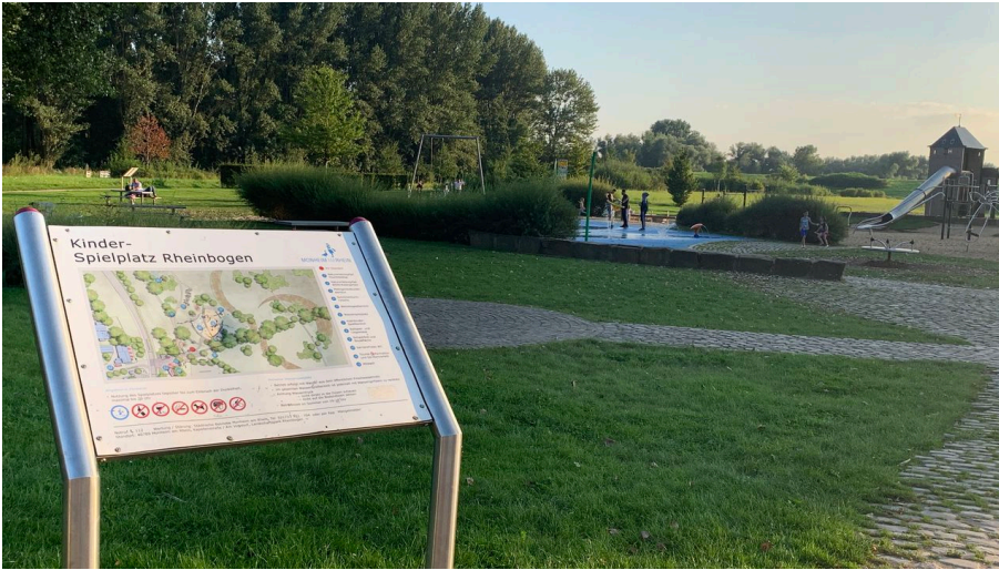
Rheinbogen mit Wasserspielplatz in Monheim am Rhein