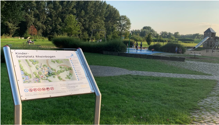
Rheinbogen mit Wasserspielplatz in Monheim am Rhein