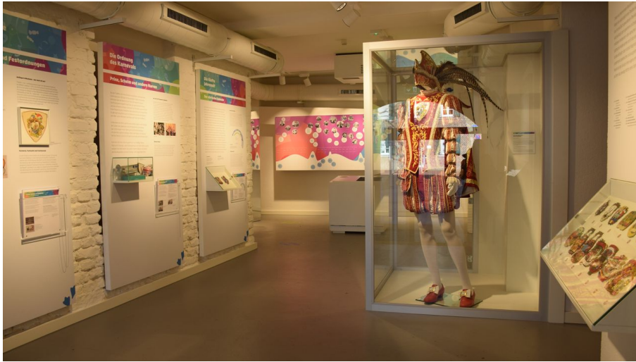
Karnevalskabinett in Monheim am Rhein