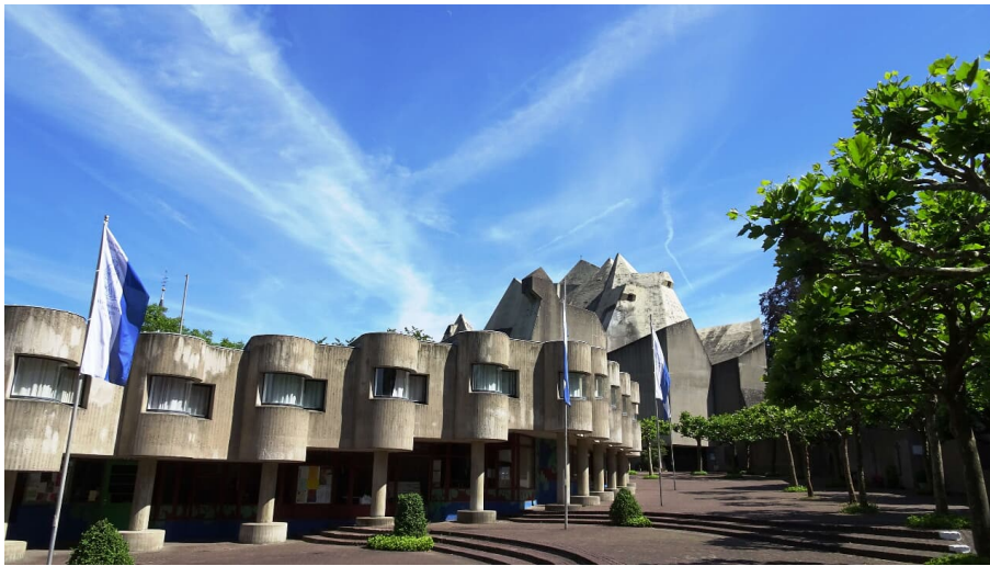
Pilgerort Mariendom in Velbert-Nevigés