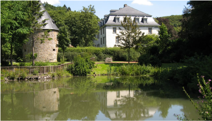
Schloss Hardenberg in Velbert-Nevigés