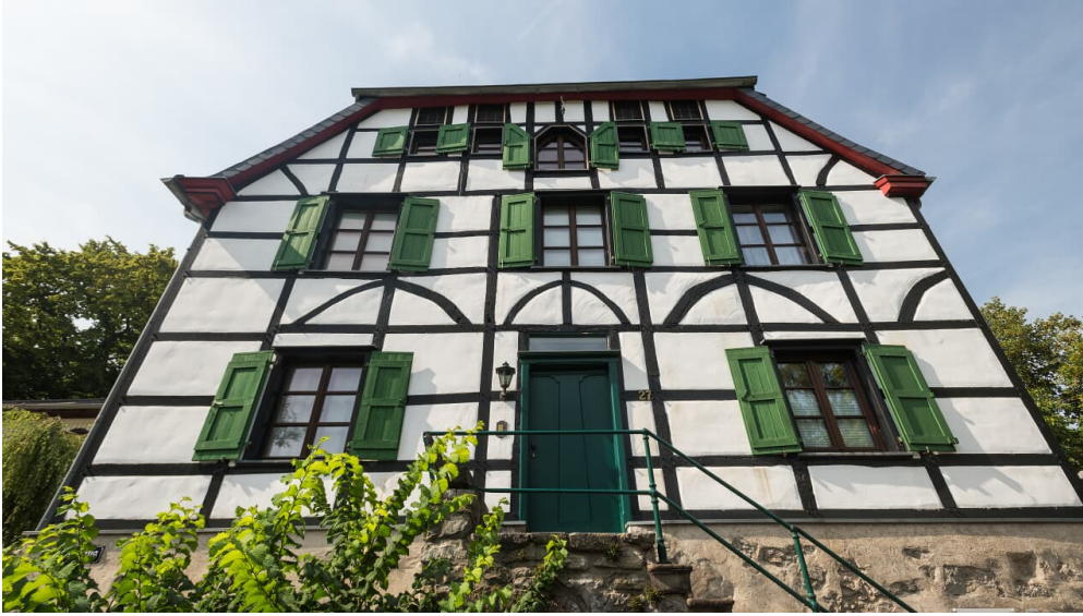
Altes Doktorhaus in Haan-Gruiten