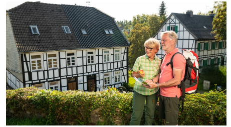
Unterwegs in Haan-Gruiten