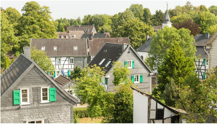
Dorf Gruiten in Haan - © Dominik Ketz, Kreis Mettmann