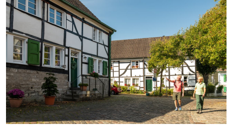
Besuch des Dorfes Gruiten