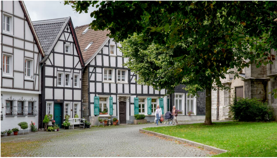
Kirchplatz in der Wülfrather Altstadt