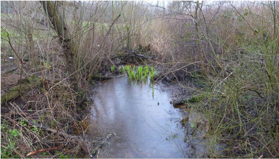
spärlicher Rest vom Altrheinarm