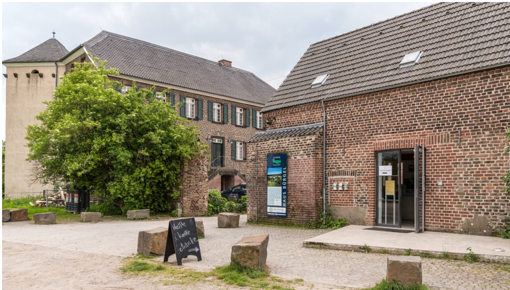
Haus Bürgel in Monheim am Rhein

Biologische Station: Montag bis Freitag von 9:00 Uhr bis 13:00 Uhr