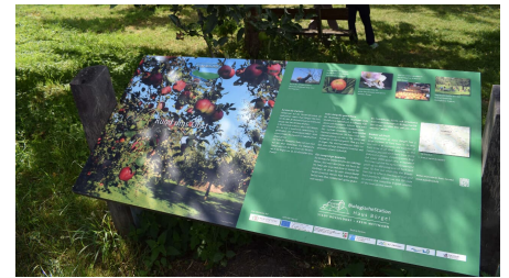
Infotafel zur Obstwiese der Biologischen Station bei Haus Bürgel in Monheim am Rhein