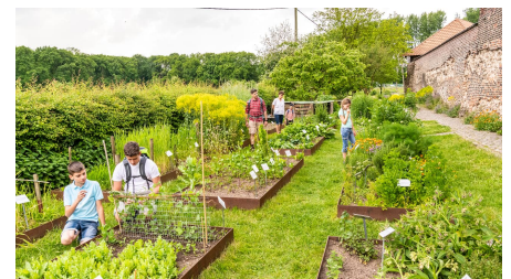
Kräutergarten der Biologischen Station von Haus Bürgel in Monheim am Rhein