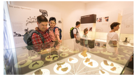
Römisches Museum Haus Bürgel in Monheim am Rhein