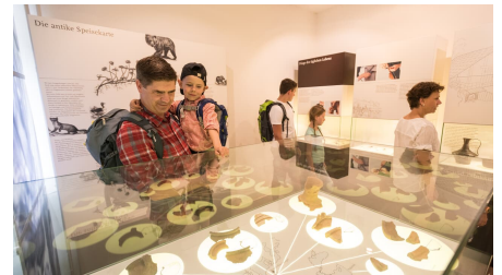
Römisches Museum Haus Bürgel in Monheim am Rhein