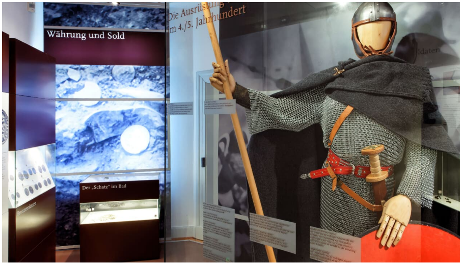
Römisches Museum Haus Bürgel in Monheim-am-Rhein