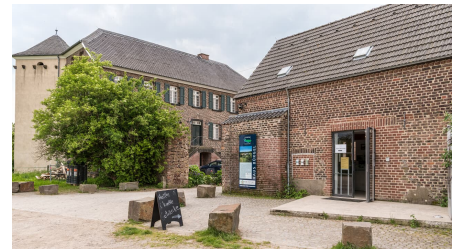
Haus Bürgel in Monheim am Rhein