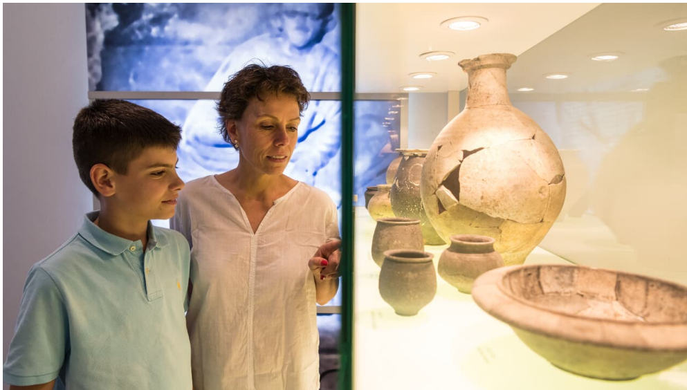
Römisches Museum Haus Bürgel in Monheim am Rhein

- Samstag, Sonntag und an Feiertagen von 10 bis 18 Uhr - Winterpause vom 01.12. bis 31.01. - Führungen sowie Programme für Schulklassen und Kindergruppen sind auch abseits der Öffnungszeiten auf Anfrage möglich