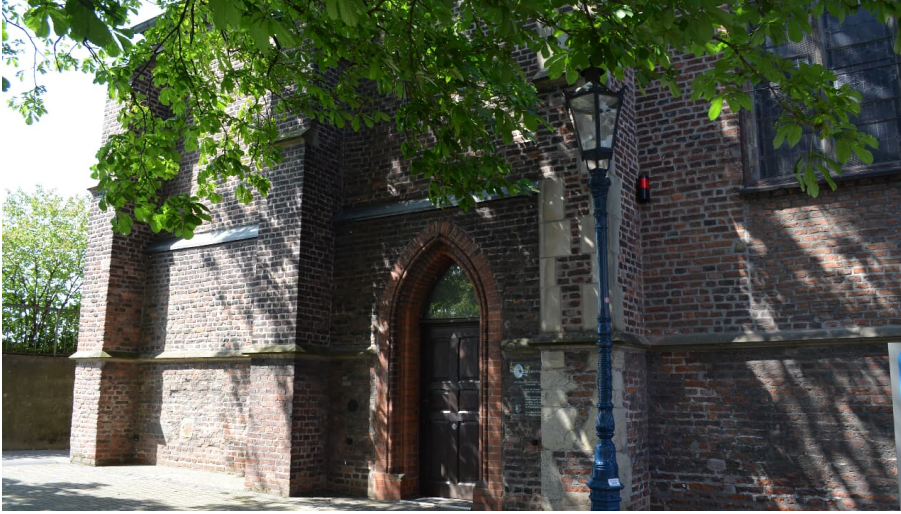
Marienkapelle in Monheim am Rhein