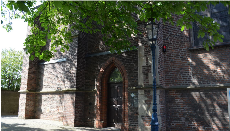
Marienkapelle in Monheim am Rhein