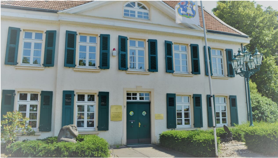
Deusser Haus in Monheim am Rhein