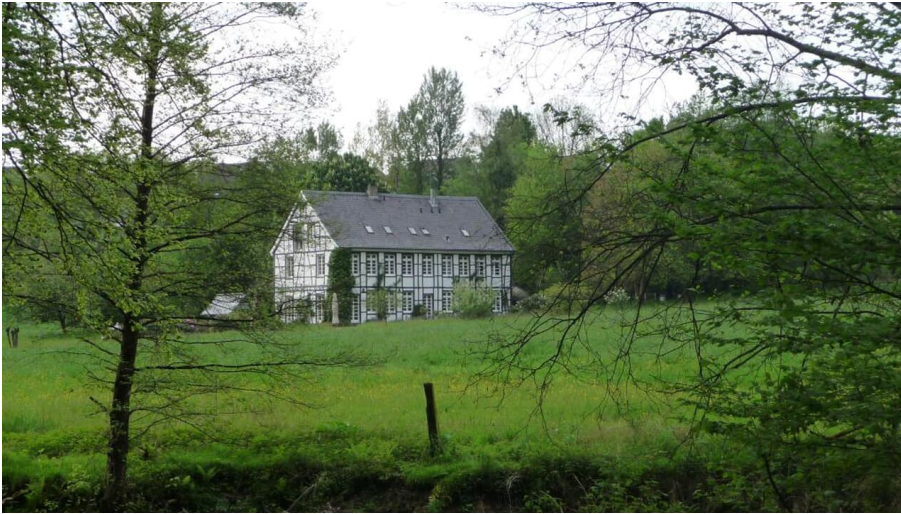
Brucher Kotten von der Itterseite aus