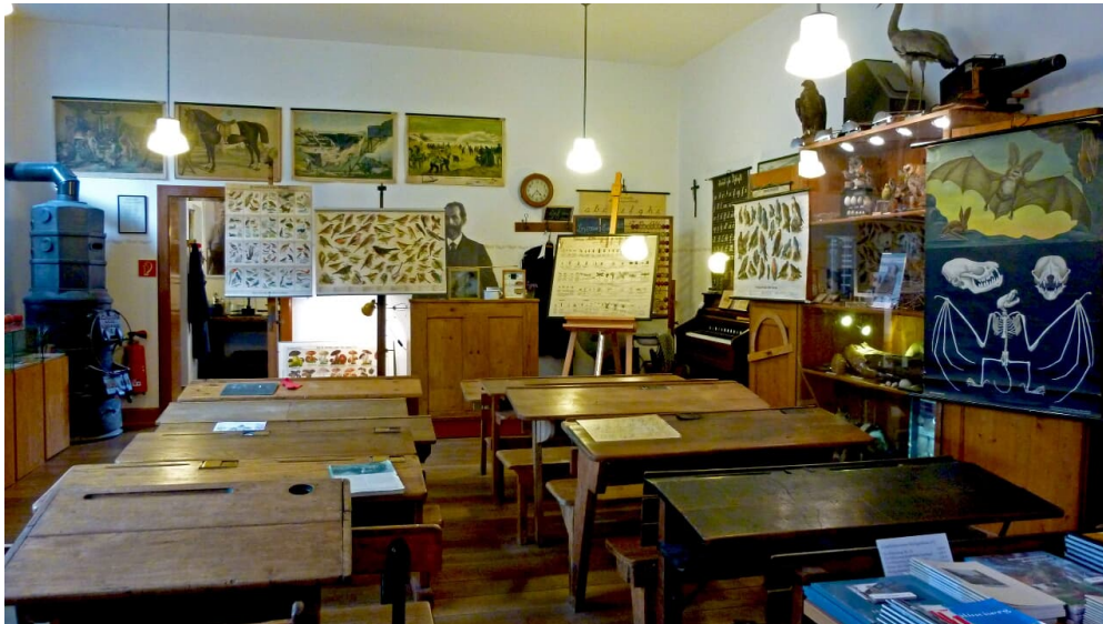
Klassenzimmer im Museum Abtsküche in Heiligenhaus

Das Museum ist grundsätzlich Samstags und Sonntags geöffnet. Weitere Öffnungen nach Absprache möglich.