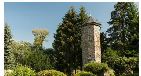
Blick auf den Turm von Schloss Hetterscheid bei der Abtsküche in Heiligenhaus