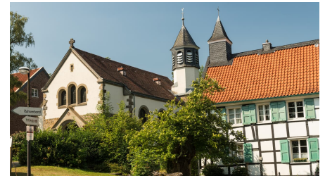
Abtskücher Kapelle St. Jakobus und Hof in Heiligenhaus