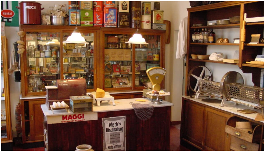
Kaufläden im Museum Abtsküche in Heiligenhaus