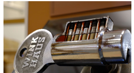
Exponat des Deutschen Schloss- und Beschlägemuseums in Velbert