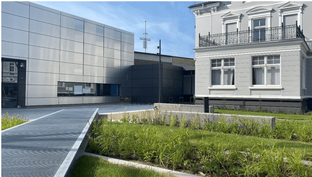
Deutsches Schloss- und Beschlägemuseum in Velbert