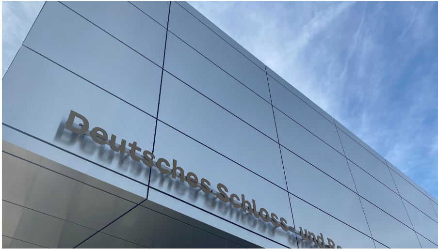
Deutsches Schloss- und Beschlägemuseum in Velbert