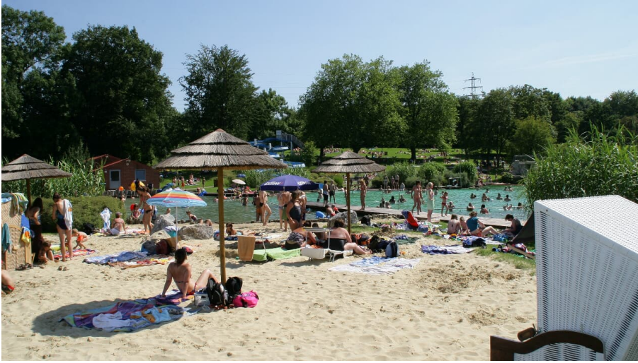
Naturfreibad Mettmann - © Kreisstadt Mettmann