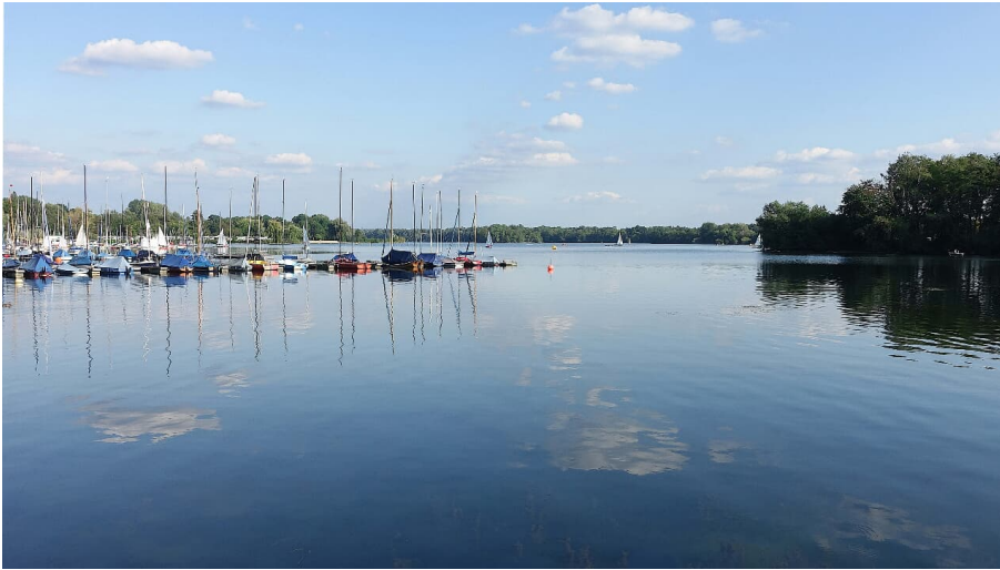
Boothafen am Unterbacher See bei Erkrath und Hilden