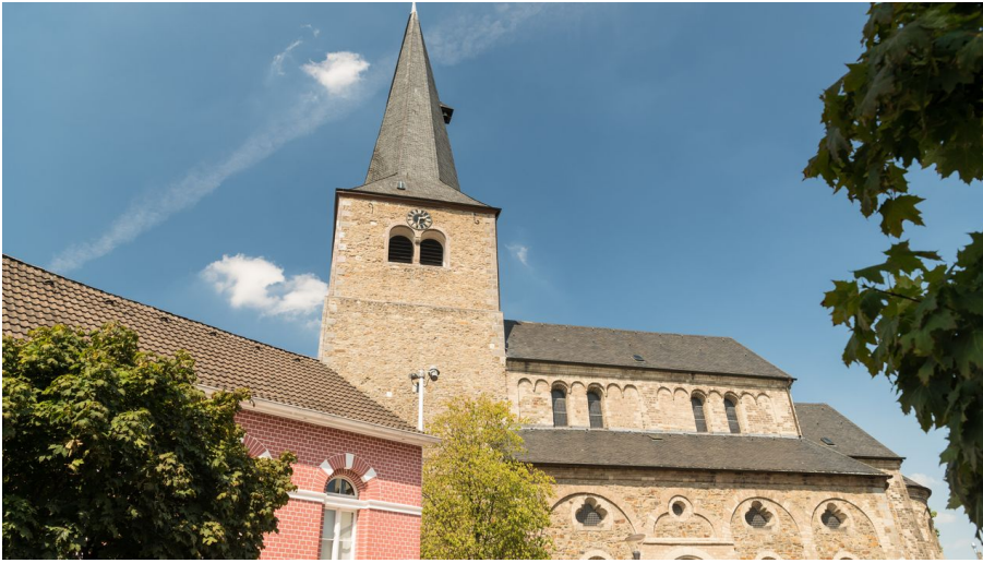
Reformationskirche zu Hilden