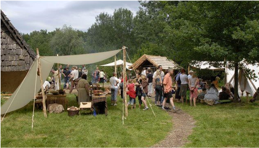
Eisenzeitlicher Handwerkermarkt