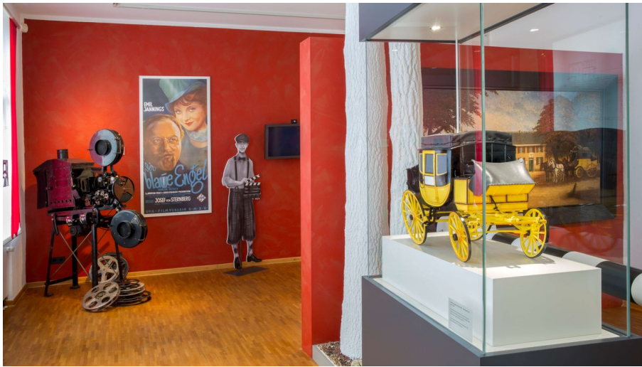
Stadtmuseum Langenfeld