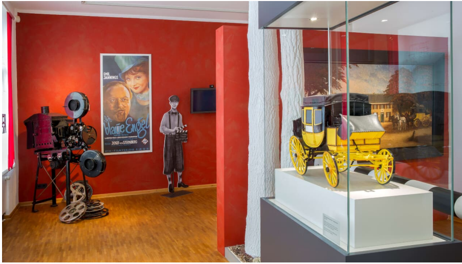
Stadtmuseum Langenfeld