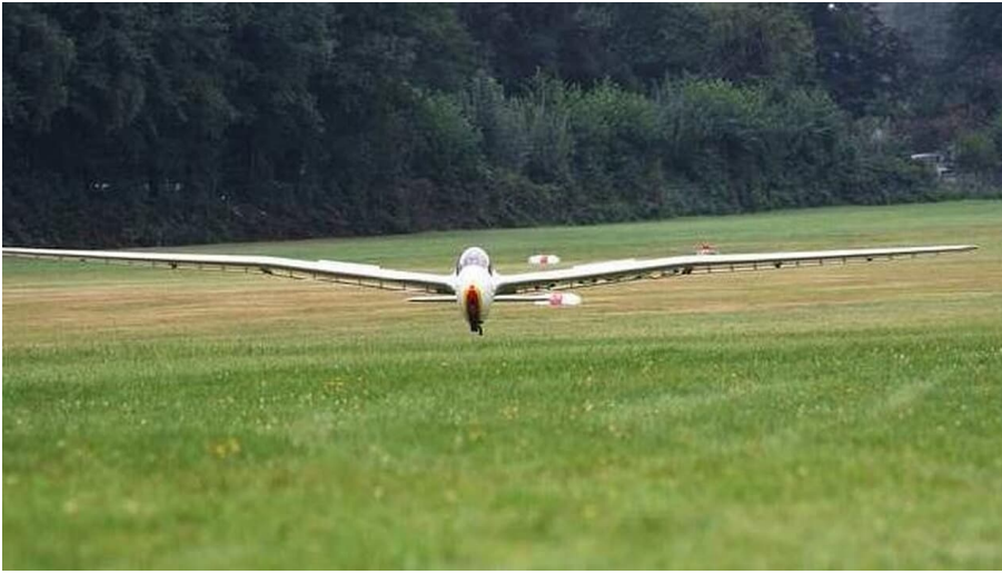
LSG Erbslöh