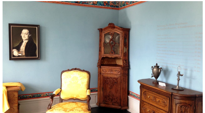
LVR-Industriemuseum Textilfabrik Cromford in Ratingen