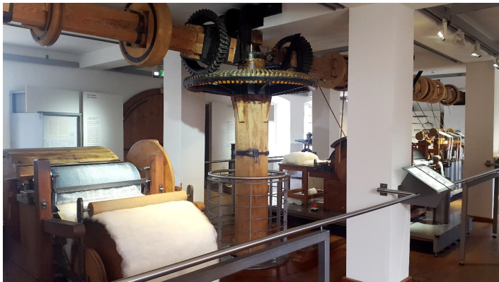
Webstühle im LVR-Industriemuseum Textilfabrik Cromford in Ratingen

Weiberfastnacht bis Karnevalsdienstag geschlossen Betriebsferien Heiligabend bis Neujahr