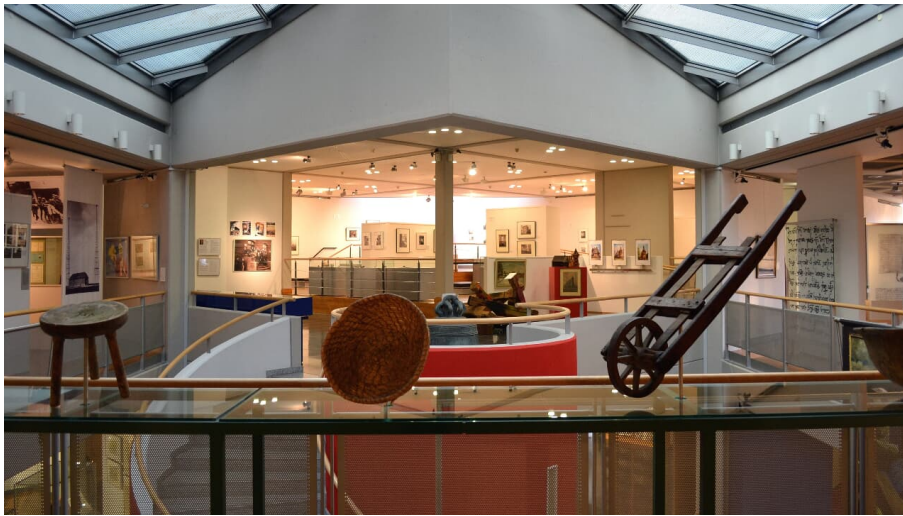
Oberschlesisches Landesmuseum in Ratingen