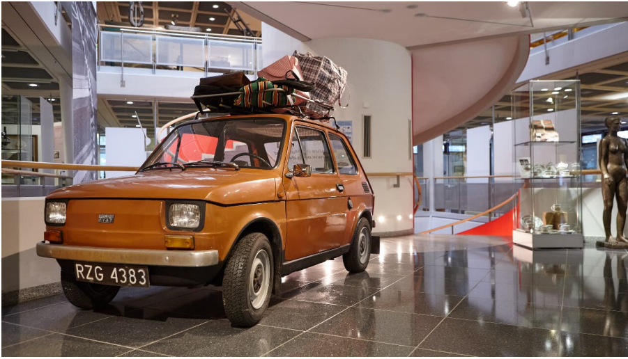
Oberschlesisches Landesmuseum in Ratingen