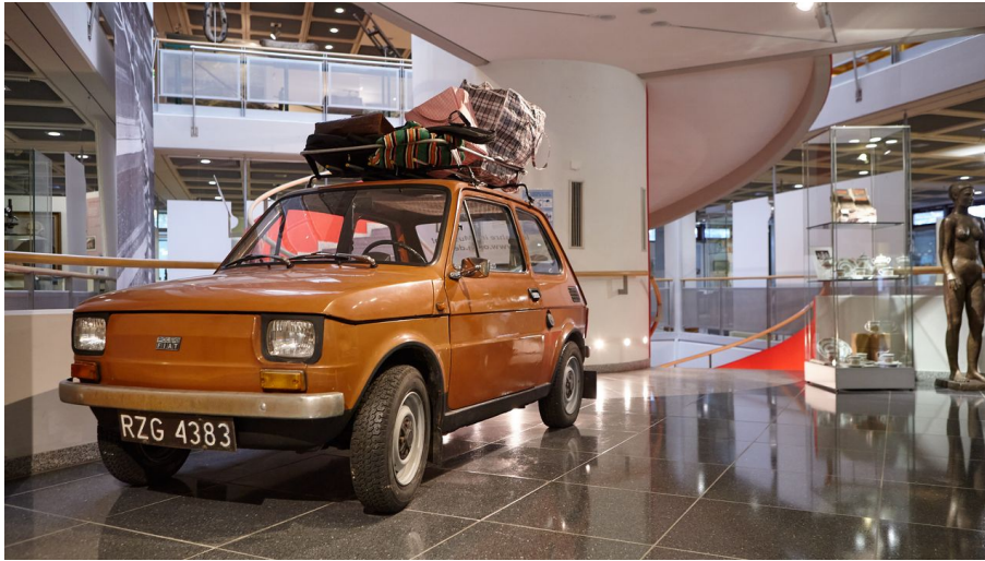
Oberschlesisches Landesmuseum in Ratingen