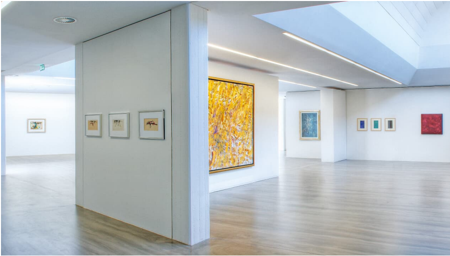
Museum Ratingen