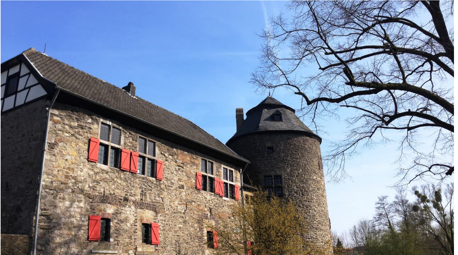
Wasserburg Haus zum Haus in Ratingen