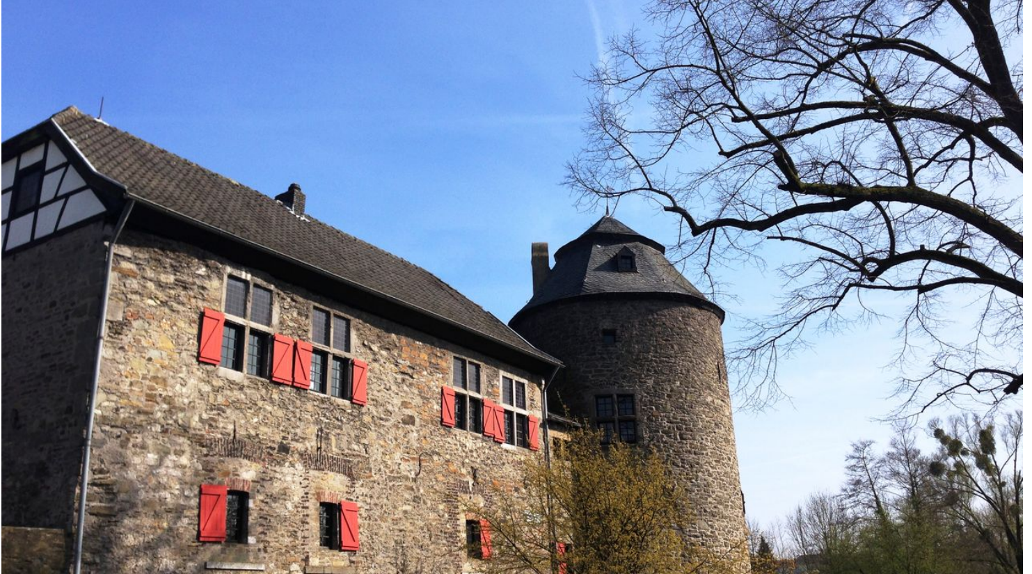
Wasserburg Haus zum Haus in Ratingen