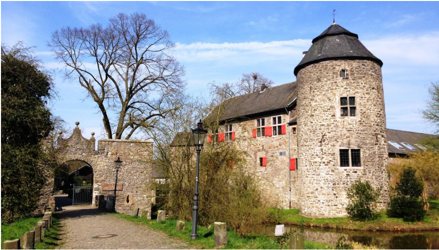
Wasserburg Haus zum Haus in Ratingen