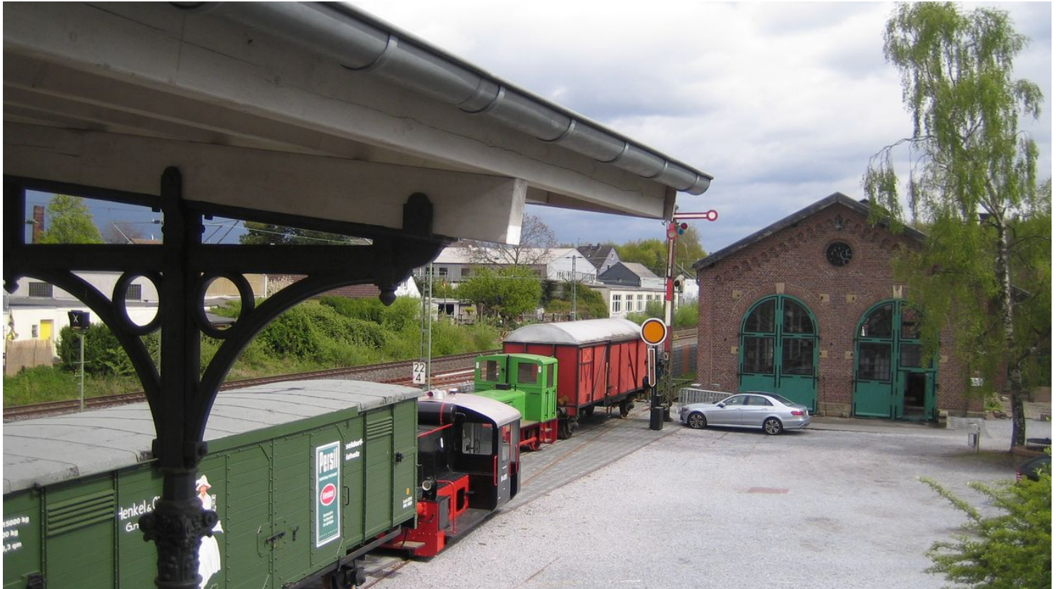
Blick auf den Bahnsteig