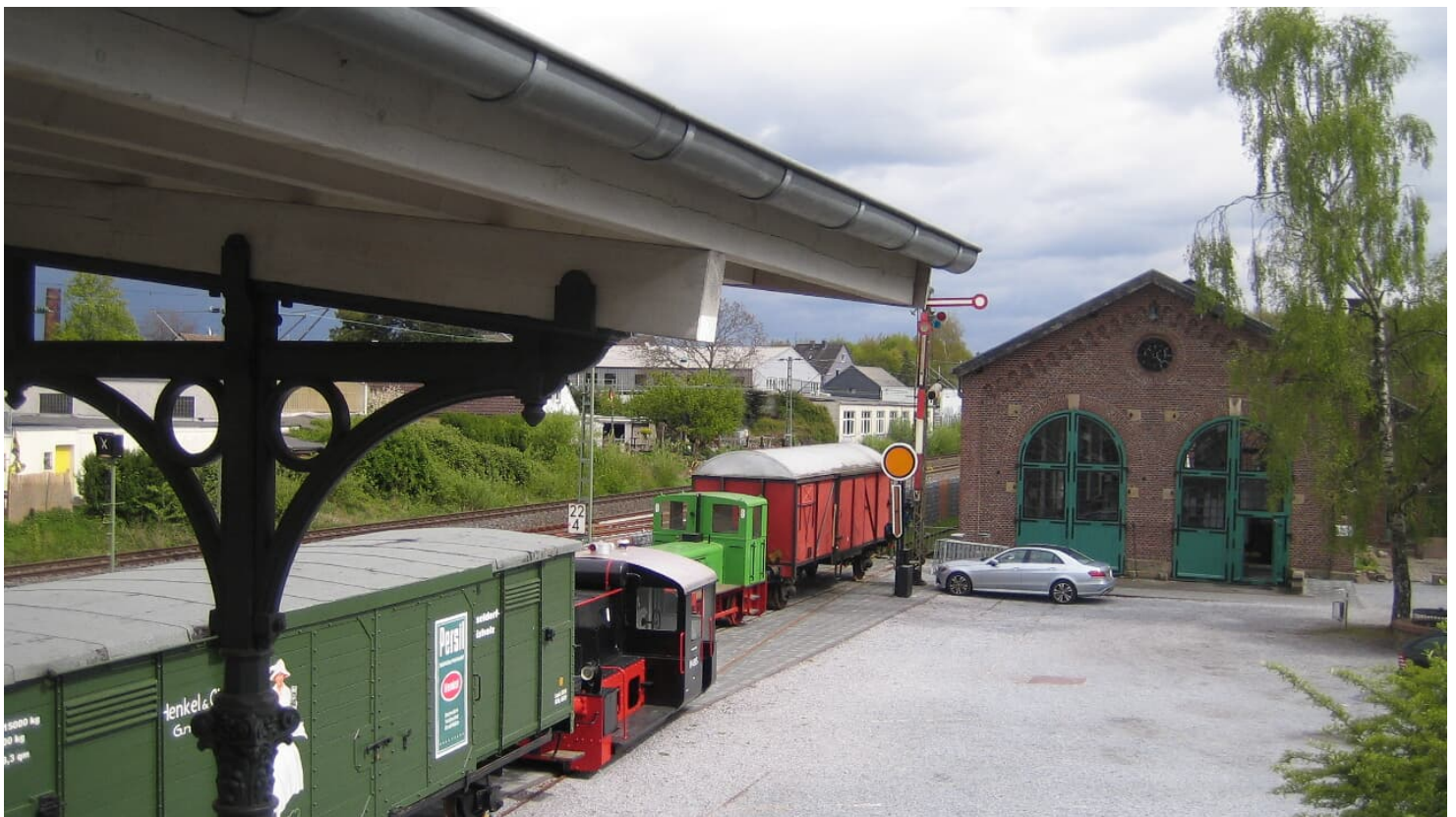
Blick auf den Bahnsteig

Geöffnet jeden 4. Sonntag von April bis Oktober, zwischen 11:00 - 17:00 Uhr. Führungen nach Absprache möglich