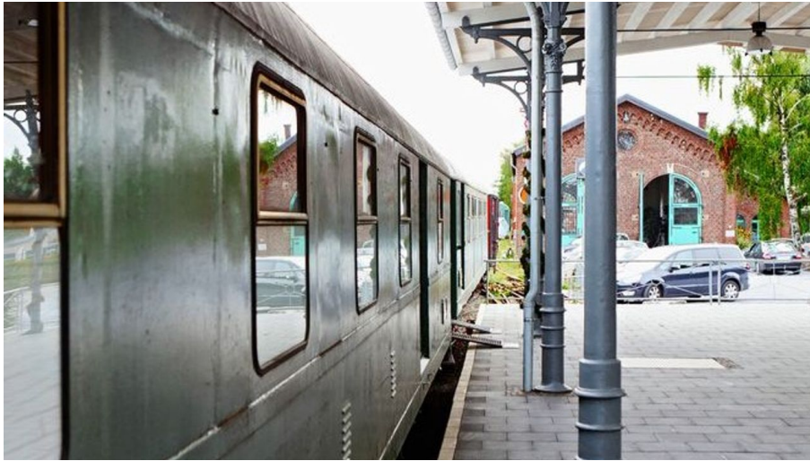
Bahnsteig am Lokschuppen (Erkrath-Hochdahl)