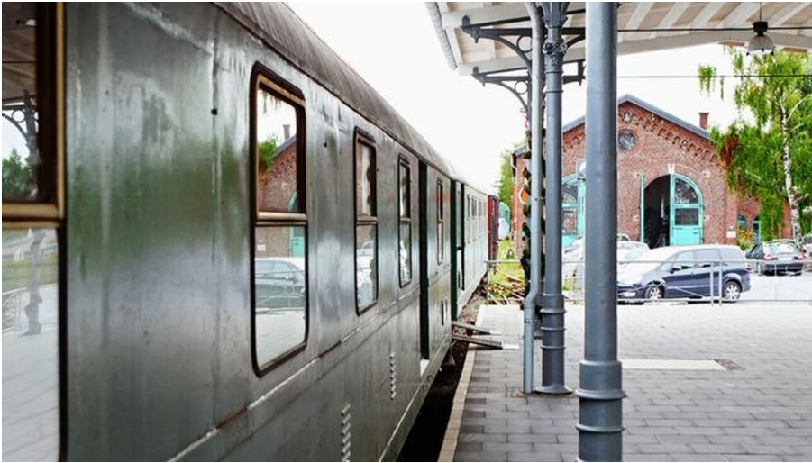
Bahnsteig am Lokschuppen (Erkrath-Hochdahl)