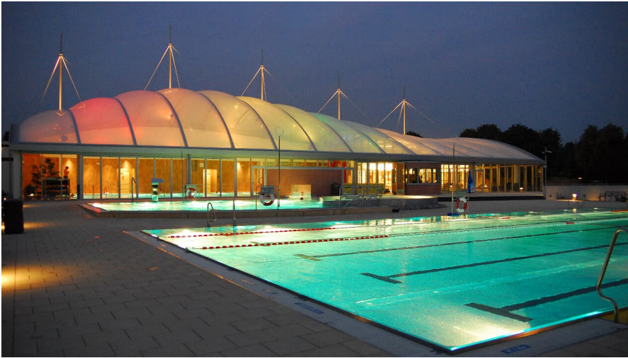
Allwetterbad Lintorf in Ratingen