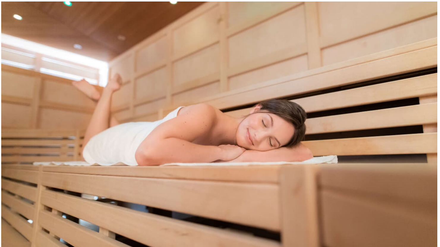
Sauna Lintorf in Ratingen