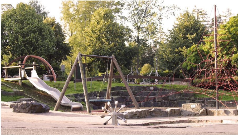
Spielplatz Herminghauspark in Velbert