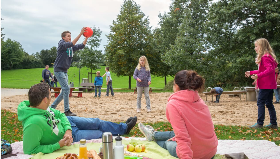
Freizeitpark Langfort in Langenfeld